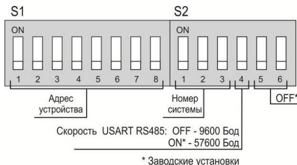
Рисунок 3 – Назначение переключателей.